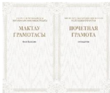
Почетная грамота Министерства образования и науки Республики Татарстан 2004 год